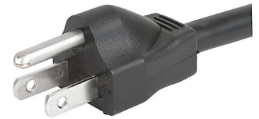
009 USA NEMA 5-15