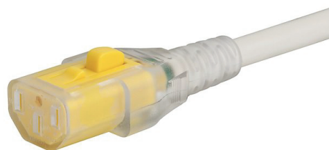
033 C13 V-LOCK Hospital