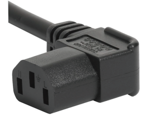
023 C13 Winkel