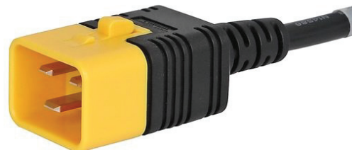
031 V-LOCK C20