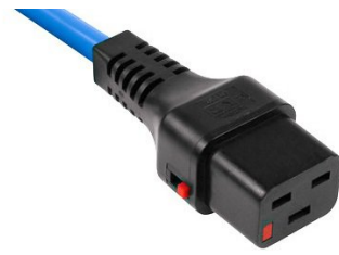
0035 IEC-LOCK-PLUS C13