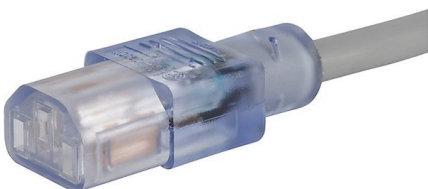
032 C13 Hospital