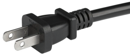
008 USA NEMA 1-15