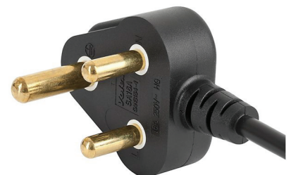
015 Südafrika | Indien