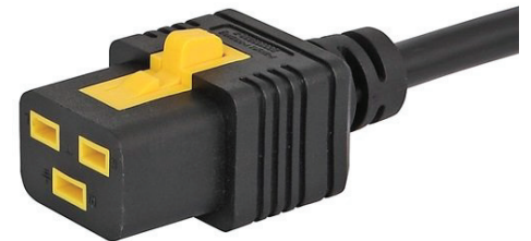
029 V-LOCK C19