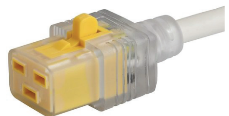
034 C19 V-LOCK Hospital