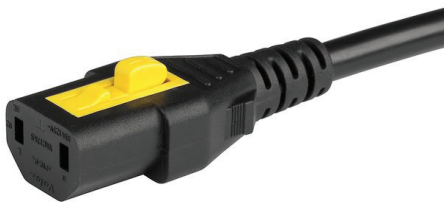
027 V-LOCK C17