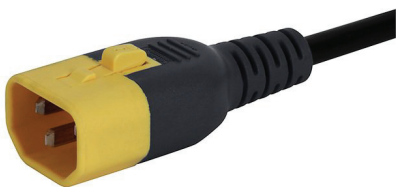
030 V-LOCK C14