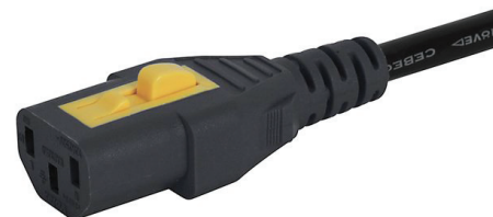
028 V-LOCK C13