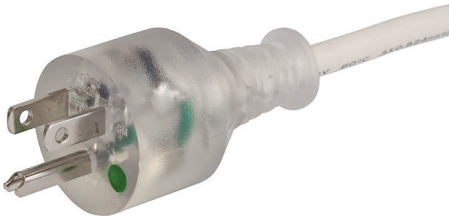
010 USA NEMA 5-15 Hospital